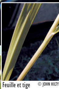
Feuille et tige © JOHN HILTY