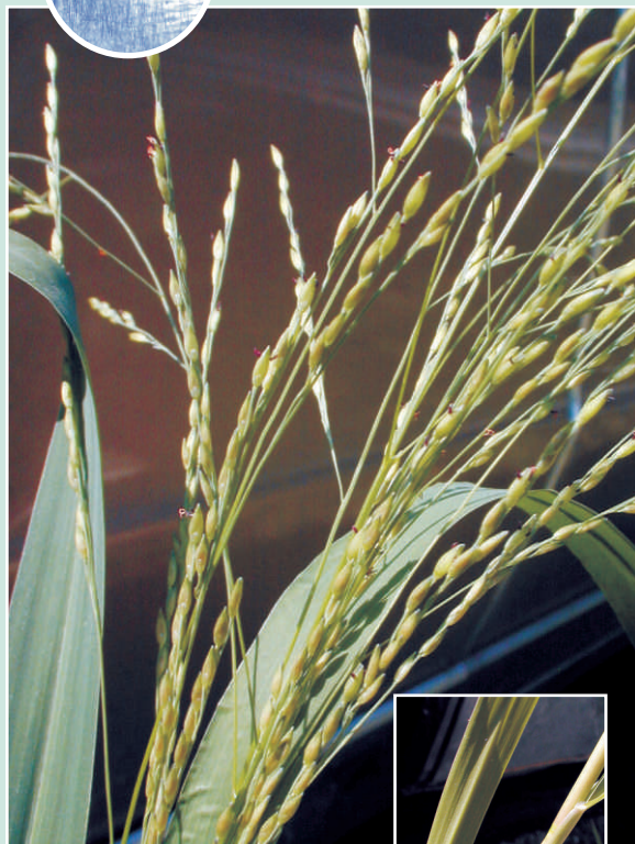
Panicum dichotomiflorum